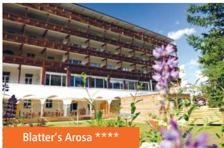
Blatter's Arosa ****

Cet excellent établissement en mains familiales dispose de 130 lits, d'une grande piscine intérieure, d'une terrasse ensoleillée, d'un sauna, d'un bain de vapeur, d'un centre de bien-être, d'un restaurant et d'un bar décoré en bois de pin suisse avec animation musicale. Il est situé non loin du centre, à 20mn à pied de la gare.