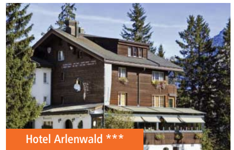
Hotel Arlenwald ***

A 500m du téléphérique et de la gare ferroviaire d'Arosa, cet établissement exploité par la famille propriétaire dispose d'un restaurant, d'un bar, d'une terrasse, de 2 jacuzzis, d'un sauna et d'une petite salle de sport. Il comprend également une salle de jeux avec un billard, un baby-foot et une console PlayStation.